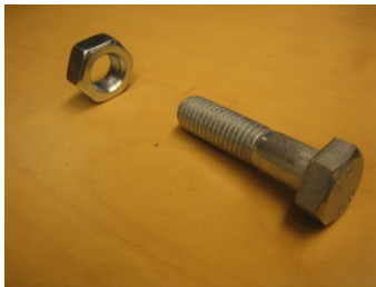
-kuvassa vasemmalla mutteri ja oikealla pultti